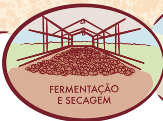
FERMENTAÇÃO E SECAGEM