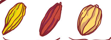
GRÃOS FINOS CACAU CRIOLLO OU TRINITARIO