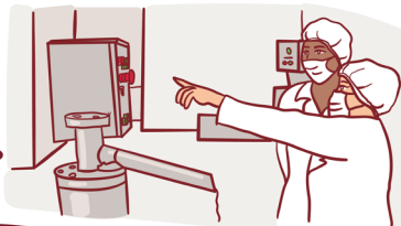
FABRICAÇÃO DE CHOCOLATE